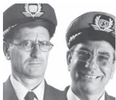
I Santini Del Prete